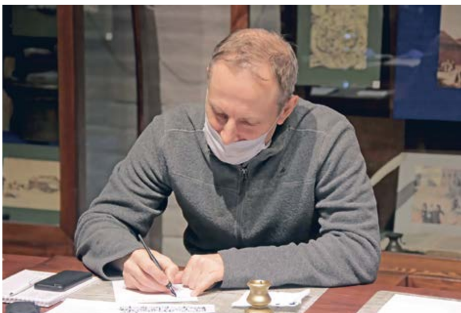
Письмо пером и чернилами в век компьютеров